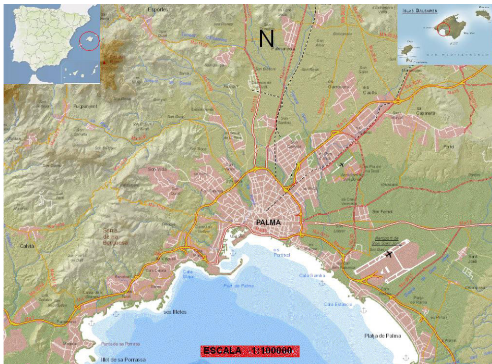
Figura 1. Palma de Mallorca y su localización en la isla.

de eventos se puedan clasificar como inundaciones de carácter local y anegamientos de tierras (Grimalt y Rosselló, 2011). El desarrollo urbanístico en la zona costera ayuda también al incremento de sucesos que se pueden relacionar además con otros factores como la topografía de las zonas afectadas, la falta de adecuación del alcantarillado y por las intensidades de precipitación causantes de los hechos. Los problemas ocasionados por las aguas son básicamente la inundación de plantas bajas y subterráneos así como problemas de tránsito por el corte de calles y pasos inferiores (Grimalt, 1992).