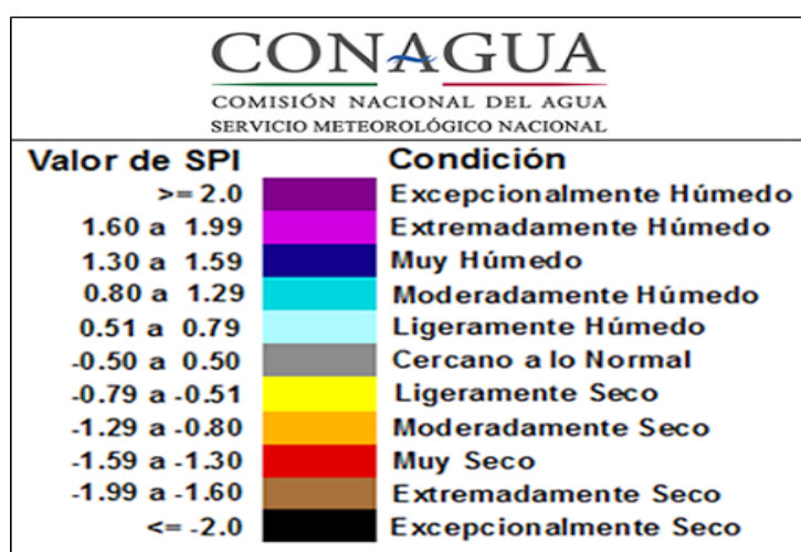
Fig. 1: Clasificación del Índice de Precipitación Estandarizada (SPI) por CONAGUA-SMN (2013)

Para realizar este análisis, se obtuvieron los datos de precipitación de cinco estaciones del Servicio Meteorológico Nacional (SMN) de enero de 1960 a diciembre de 2012. La información mostró datos faltantes y observaciones incongruentes, por lo que fue necesario estimar los datos faltantes y recalculados los datos con valores incongruentes con el procedimiento modificado de Normal-Ratio Method definido por Paulhus y Kohler (1952). Para la determinación del SPI se utilizó el procedimiento establecido por McKee et al. , (1993) y para su clasificación, se utilizó el criterio establecido por CONAGUA-SMN (2013) tal y como se muestra en la figura 1: