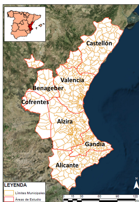
Fig. 1. Área de estudio (límites municipales y áreas pluviométricas)

Civil y están desagregados a nivel municipal, mientras que la información de pluviometría corresponde a la base de datos sobre episodios de lluvia generados en el seno del proyecto RAINMED, desarrollado en la Universidad de Valencia. Este proyecto abarca el territorio de la Confederación Hidrográfica del Júcar (CHJ), dividido en 11 unidades espaciales homogéneas (denominadas zonas), siguiendo criterios topográficos e hidrológicos (Camarasa y López, 2006). Siete de las once unidades afectan a la Comunidad Valenciana (Castellón, Valencia, Benageber, Alzira, Cofrentes, Alicante y Gandía) y en este trabajo han sido utilizadas como referencia espacial de ubicación de los episodios de lluvia (figura 1).