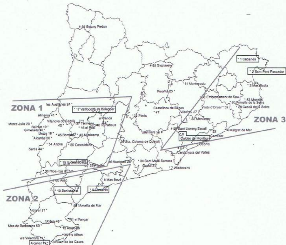
Figura 1: Mapa de situación de las zonas agroclimáticas y de los observatorios que componen la XAC

Hay que tener en cuenta que dada la juventud de la XAC, las series son todavía poco maduras desde un punto de vista climático. Así, el estudio tendrá los siguientes observatorios (la fecha final de todos es el 21/5/1999):